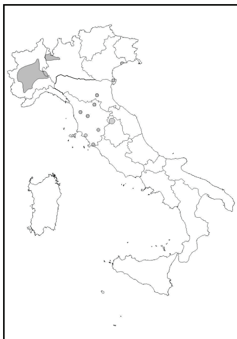
Area di distribuzione